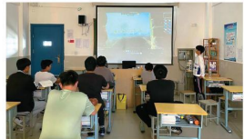
机电工程系在进行班团活动

也通过这次活动，给大家进行心理疏导，送出爱心，一如既往的勤奋学习，他立下更高的人生志向，要改变人生，就要攀登更高的山峰。他每学期的综合成绩在年级始终名列前茅，每学年均获校级奖学金，并获2019-2020学年天津市人民政府奖学金。他积极进取，大学期间被发展为中共党员，并担任党支部组织委员和宣传委员以及班级团支部书记等多项职务，他积极参加学院竞赛并取得省级二等奖和申请实用新型专利等多项成果，多次获得“优秀学生干部”、“优秀学生干部”等荣誉称号。经过不懈的努力，他考入“211”重点高校硕士研究生，开启了人生的新篇章。